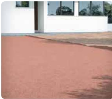
1 Limpiar, alisar y compactar el terreno.