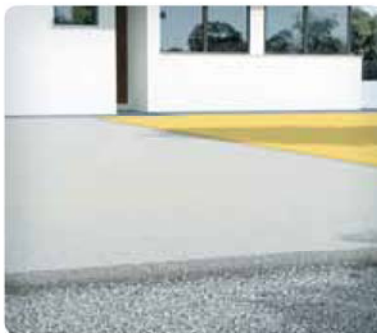
4 Aplicar PAVILAND DRENANTE en un espesor de entre 5 y 7 cm amasando cada saco con 1,75 L de agua, compac-

tando mediante golpeo con llana o regla vibradora (evitar fratasar y / o alisar para no tajar el poro). Se realizarán juntas de trabajo, mediante junquillos flexibles o similares, aproximadamente cada 30 m 2 , respetando así mismo las juntas perimetrales y estructurales.