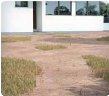
Terreno sin preparar