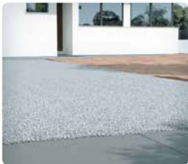
3 Usar una base de grava de tamaño entre 3-12 mm, bien compactada, como base para el hormigón drenante.