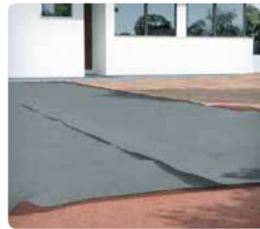
2 Colocar el geotextil PAVIGARDEN ANTIHIERBAS.